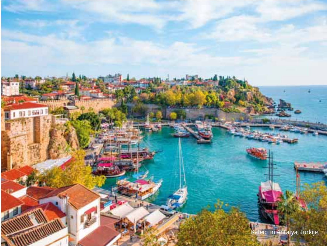
Kaleici in Antalya, Turkije