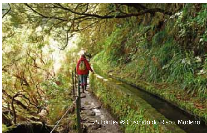
25 Fontes &amp; Cascada da Risco, Madeira