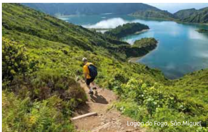
Lagoa do Fogo, São Miguel

Op zo'n vier uur vliegen van Brussel liggen pareltjes van eilanden, de Azoren en Madeira. Met lentetemperaturen het hele jaar door, ideaal om ook in de wintermaanden de wandelschoenen aan te trekken. Graag nog zuidelijker actief genieten op Kaapverdië? Geen betere manier om de landschappen te ontvouwen, dan een stevige tocht langs imposante kliffen en groene valleien.