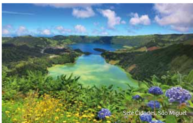
Sete Cidades, São Miguel